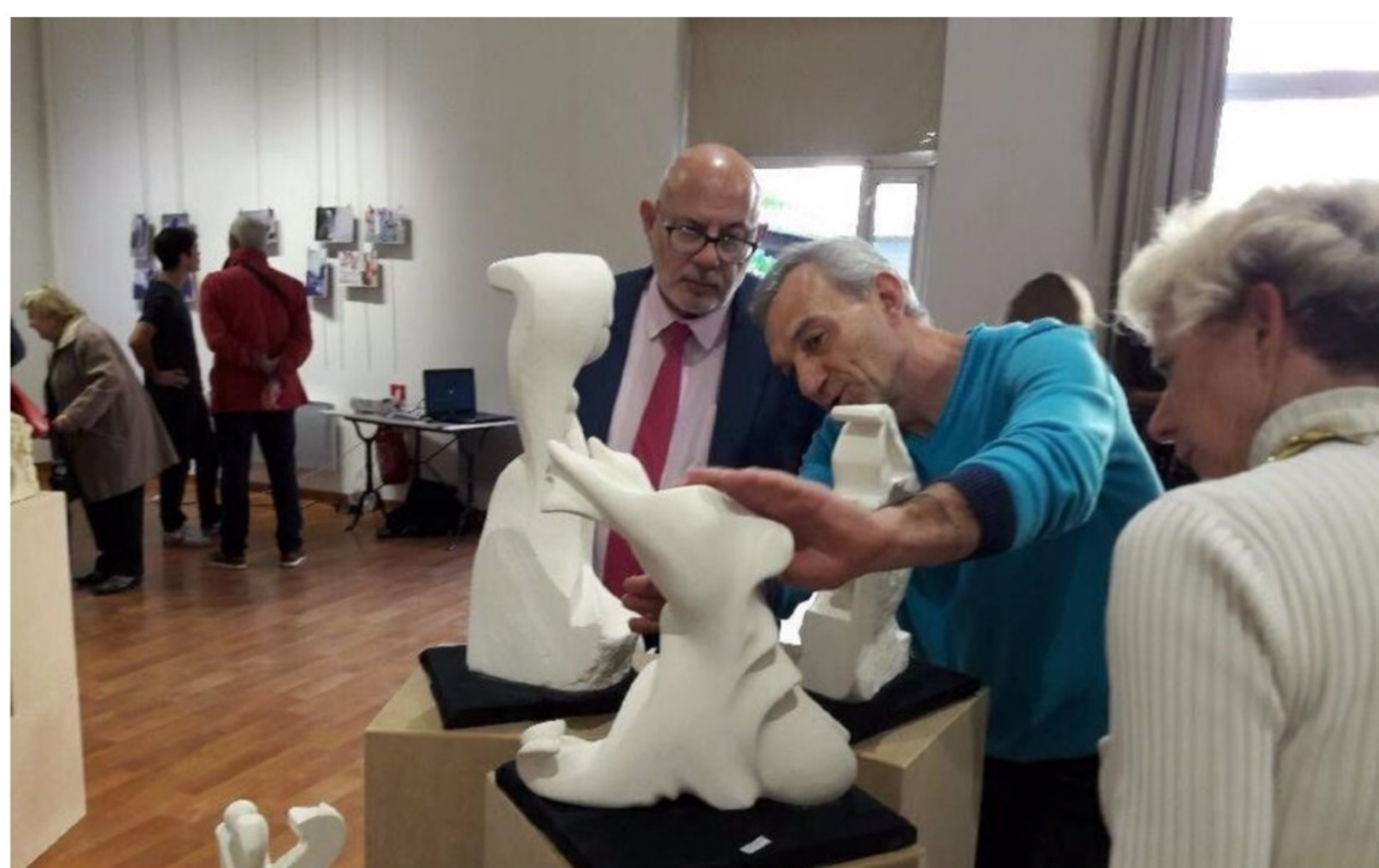
Alfortville, ce mardi. Le sculpteur arménien Arestakes expose au 148 à Alfortville.

Cette semaine, les différents équipements font leur rentrée, avec en point d'orgue ce samedi, un parcours proposé aux habitants, à travers la ville.