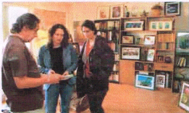
Thierry Morin, photographe maisonnais de natures mortes, d'objets d'art et de reportages a exposé ses principales muses qui sont les fleurs et la mer lors des 16 et 17 avril derniers.