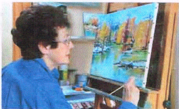
Passionnée par la nature, ses lumières et ses matières, Anik Rachez croque sur place ses sujets pour les retravailler dans son atelier.